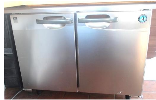
● 冷蔵コールドテーブル 173ℓ