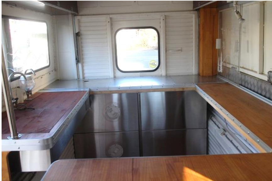
● 内装全体 (前方→後方)