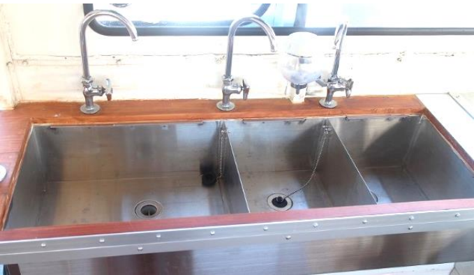
● 上水道&シンク(二層+手洗い)